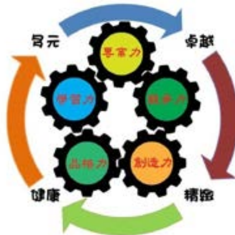
【形塑學生五種核心能力】